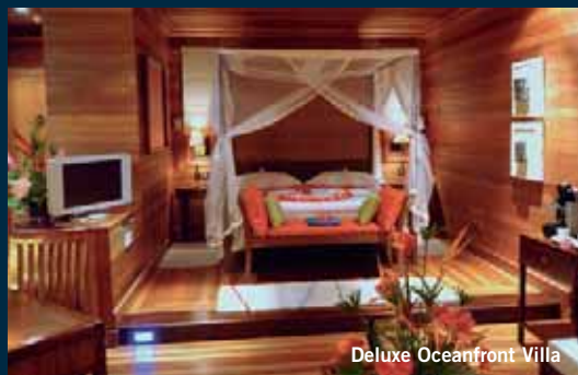
Deluxe Oceanfront Villa