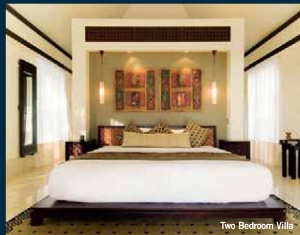
Two Bedroom Villa