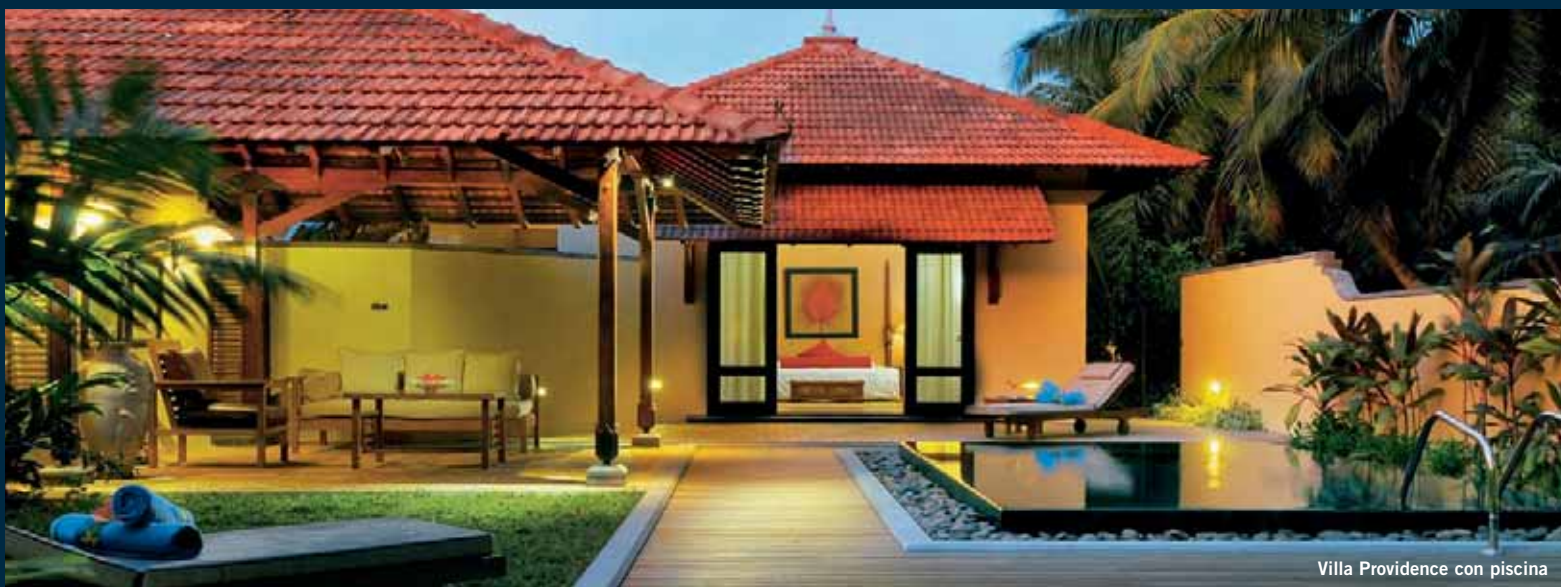
Villa Providence con piscina

propongono prelibati menu delle tradizioni più diverse che soddisfano pienamente anche i buongustai più esigenti. Tennis, vela, windsurf, kayak, snorkelling, immersioni subacquee e affascinanti escursioni a bordo di barche con fondo di vetro sono fra le tante attività sportive cui possono dedicarsi gli ospiti del resort che hanno anche a disposizione uno dei migliori centri benessere delle Seychelles : Spa by Clarins che dispone di saune, hammam, fitness center, sale per balneoterapia e per massaggi con un ricco menu di trattamenti rigeneranti e rilassanti.