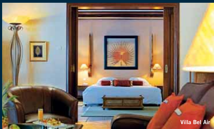
Villa Bel Air