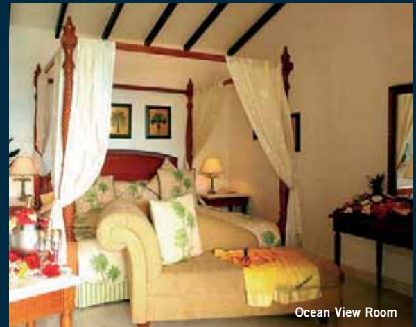
Ocean View Room