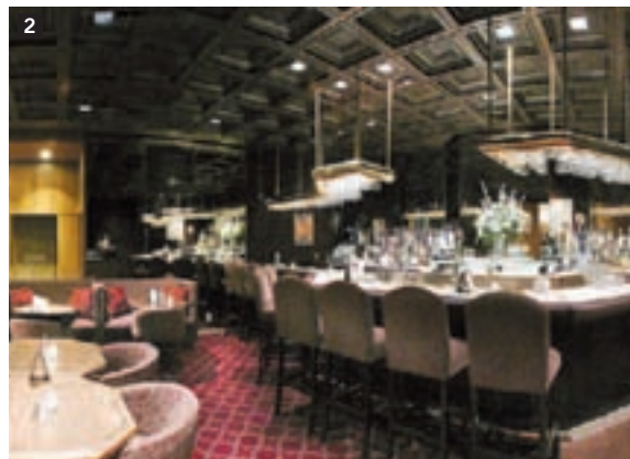
Helmsley New York