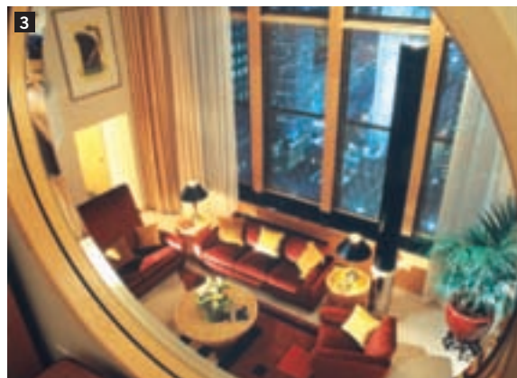
New York Palace Hotel