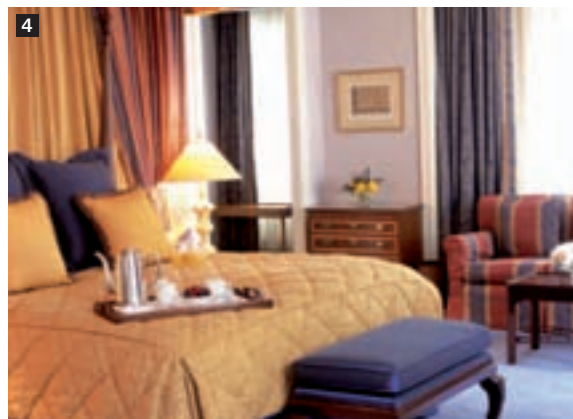
InterContinental The Barclay