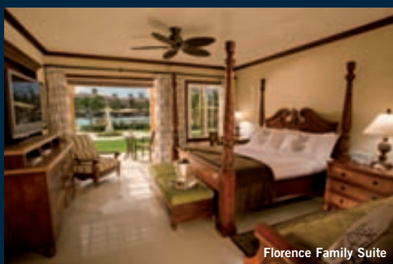
Florence Family Suite