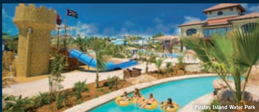
Pirates Island Water Park