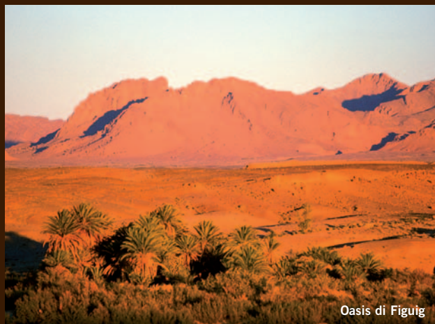
Oasis di Figuig