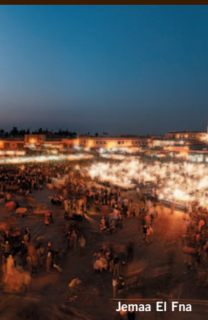
Jemaa El Fna