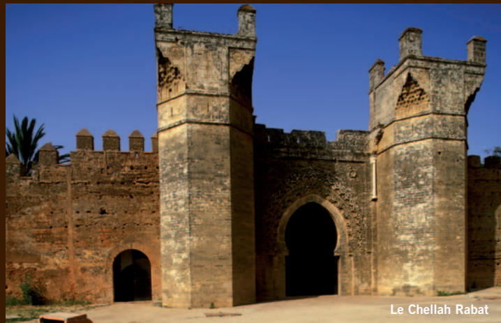
Le Chellah Rabat