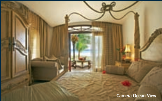
Camera Ocean View