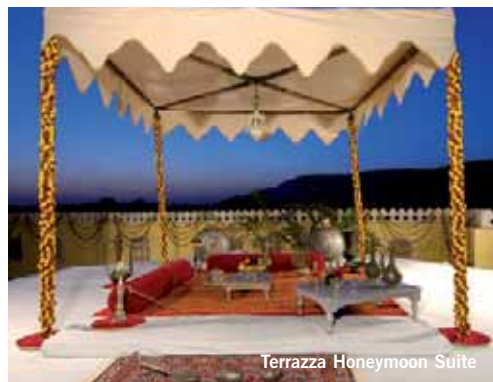
Terrazza Honeymoon Suite