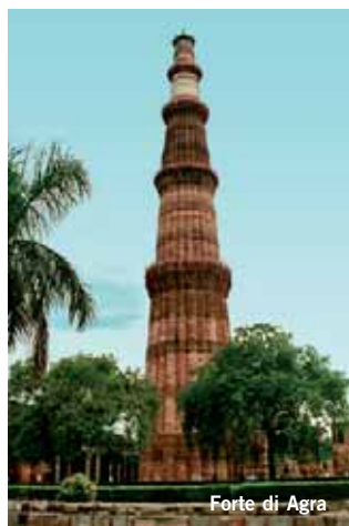
Forte di Agra