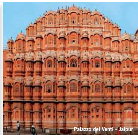
Palazzo dei Venti - Jaipur