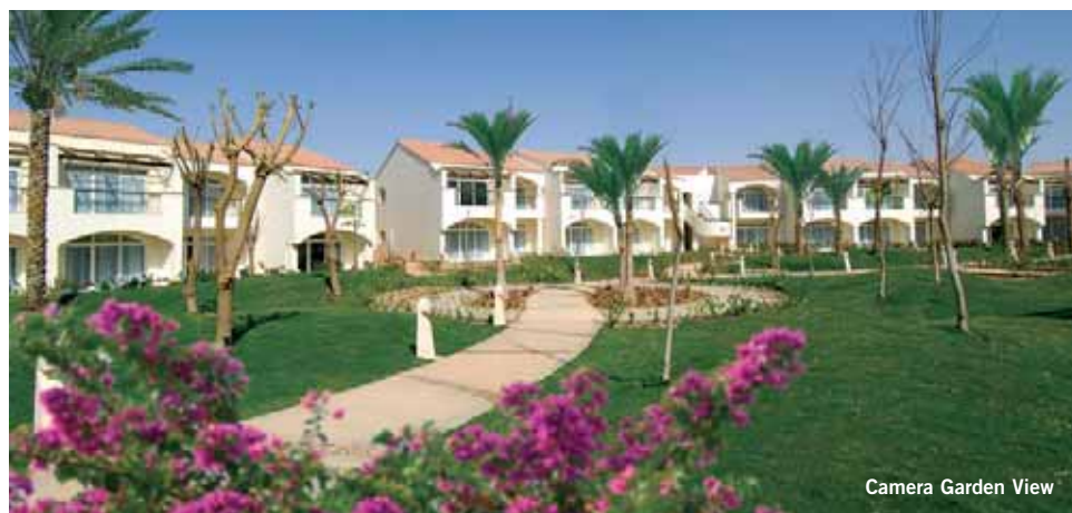
Camera Garden View