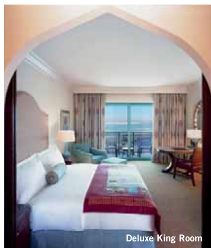
Deluxe King Room