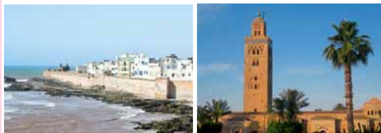
Quotazioni su richiesta

...effettua un'estensione facoltativa a El Jadida, Essaouira o Agadir