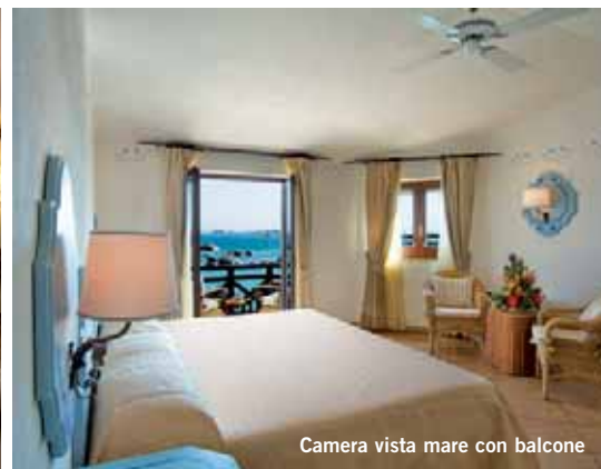
Camera vista mare con balcone