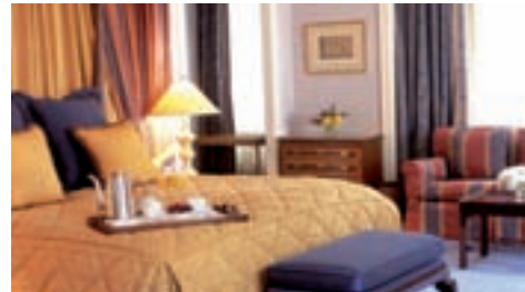
InterContinental The Barclay

Tutti i prezzi indicati nel presente "listino prezzi" sono riferiti alla data di diffusione del presente catalogo (ottobre 2009). Le schede tecniche di riferimento sono quelle pubblicate sui rispettivi cataloghi. Per molteplici ragioni tali prezzi sono suscettibili di variazioni che potrebbero dare luogo a "modifiche del listino prezzi" anche nel corso di validità del catalogo stesso. Best Tours comunicherà in ogni caso, al momento della richiesta di prenotazione, le quotazioni secondo il "listino prezzi" in vigore in quella data nonché eventuali variazioni dei parametri contenuti nella scheda tecnica. I listini prezzi e le rispettive schede tecniche costantemente aggiornate sono consultabili in internet sul sito www.besttours.it . Indipendentemente dal prezzo praticato, la vendita dei pacchetti turistici e dei singoli servizi turistici descritti in questo catalogo è regolata dalle "Condizioni generali di contratto di vendita del pacchetto turistico" pubblicate su ciascun catalogo di riferimento.