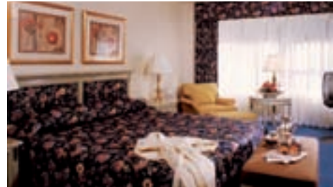
Helmsley New York