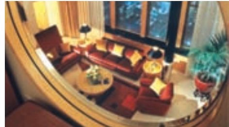
New York Palace Hotel