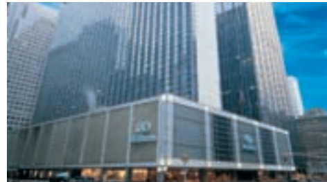
Hilton New York Hotel