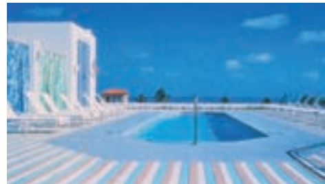
The Hotel South Beach