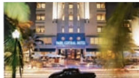
The Park Central Hotel

QUOTAZIONI PER ALTRI ALBERGHI SU RICHIESTA