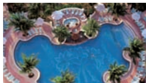
Loews Miami Beach Hotel