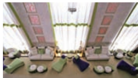
Hotel Victor South Beach